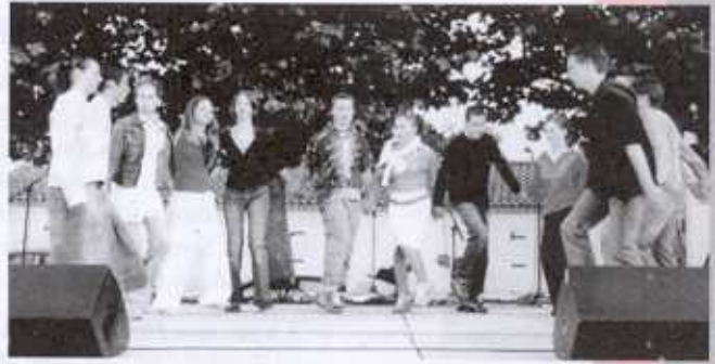
Quelques-uns des danseurs de Bé vriott' en scène aux Feux de la Saint-Jean, en 2004