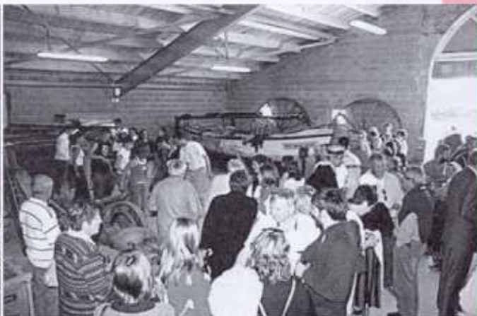
Bé Vriott' s'en donnent déjà à cœur joie tandis qu'une centaine d'invités bavardent autour du vin d'honneur.