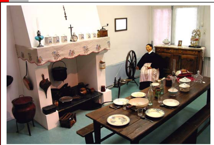
L'une des salles du musée des Traditions Populaires des Olonnes