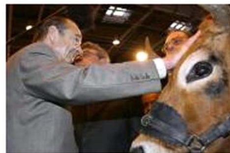
Le Président Jacques Chirac caressant le front d'Irisse, au Salon International de l'Agriculture, en février 2007