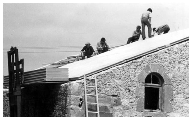
Des bénévoles d'Arexcpo travaillant pour la restauration du Vasais.