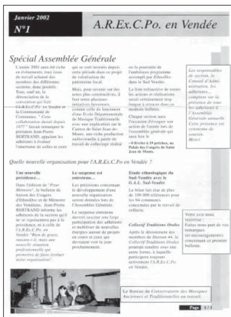
Le premier numéro du bulletin d'Arexcpo.