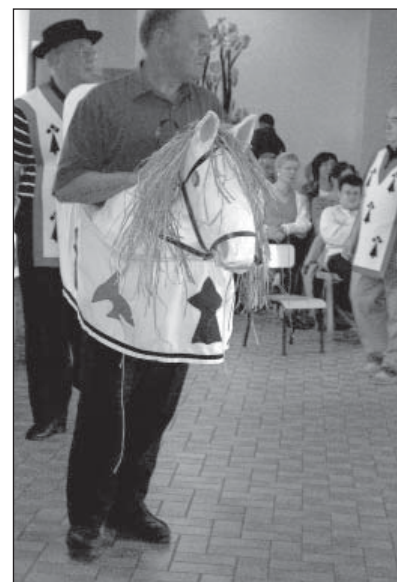
Le Cheval Mallet en 2006

Ces différentes expositions sont surtout réalisées à l'aide de photographies anciennes prêtées pour l'occasion par la population du pays. Nous en profitons pour faire appel aux services d' Arexcpo et d' EthnoDoc afin de numériser les documents prêtés et constituer ainsi une base de données sur la vie à Saint-Lumine. Actuellement notre stock de photos numérisées s'élève à 348 et nous avons bien l'intention de ne pas en rester là.