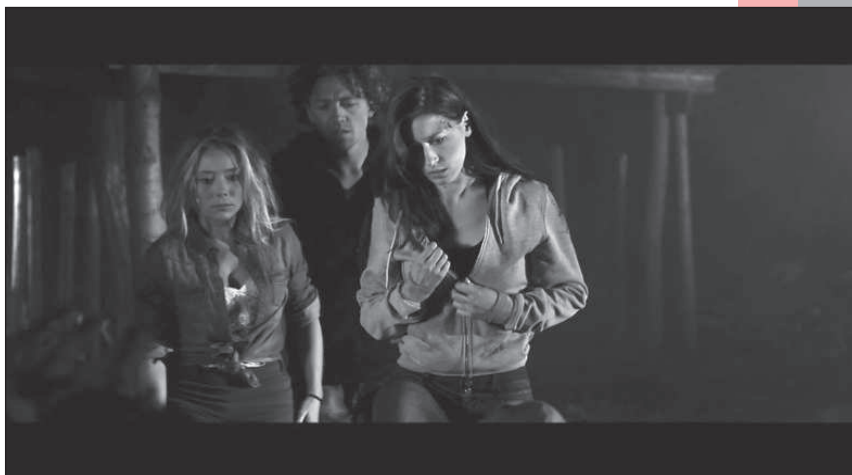
Une scène extraite du film Scylla .