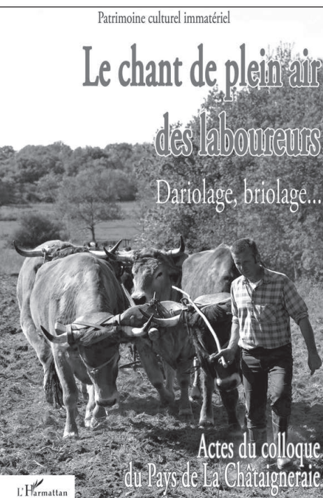
Couverture du livre Le chant de plein air des laboureurs , parution début janvier.