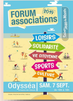
Le 7 septembre 2019 Odyssea Forum des Associations