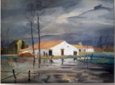
Du 1 au 14 sept. 2019 exposition des oeuvres d'Henri Darcq Au Vasais