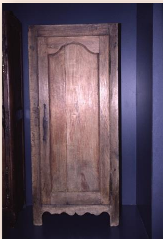
Meuble dit "cabinet" demi-armoire ou demi-presse, dit de valet, exposé au Daviaud, la Barre de Monts, portant des traces de peinture rouge, "sang de bœuf" ? du milieu du XIXe siècle provenant du Perrier.

De bon matin, les filles, se postaient sur le bas-côté de la Grand-Rue, rue du Général de Gaulle actuelle, entre le Crédit Agricole et la Maison de la presse. Les hommes étaient de l'autre côté de cette même rue, entre l'église et l'immeuble Le Patio. Le principe, pour afficher sa disponibilité, était de fixer une feuille à son corsage pour la gente féminine, à son chapeau pour la gente masculine. Selon quelques mémoires, la nature de la feuille, peuplier argenté ou pible, ormeau ou oméa... donnait une indication. Mais là, les souvenirs se sont envolés. La gagée ou le gagé recevait la moitié de son salaire qui pouvait n'être que l'engagement de la fourniture de la nourriture, du blanchiment du linge et du logement jusqu'à une somme importante pour un grand valet. Un lit était mis à la disposition de l'employé, mais pour le rangement de ses hardes, elle, il devait se prémunir. Alors, souvent les familles offraient un cabinet de valet. Une petite armoire à une porte que le gagé devait transporter d'employeurs en employeurs. Il y a encore quelques années, on pouvait trouver ces meubles de bois blanc, transportables à même le dos, chez les antiquaires et les brocanteurs.