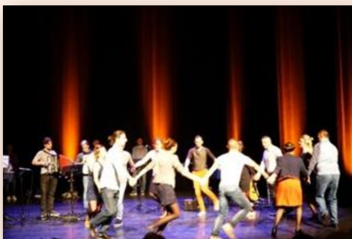
Chanteurs, danseurs, musiciens de Terre d'Islà aux Rendez-Vous du Patrimoine Vivant, aux Sables d'Olonne le 1 er mars 2019.