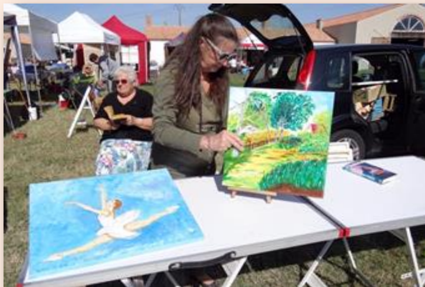
Gageries de la Saint-Michel 2018 - L'espace peintres amateurs.

L'animation sera assurée par le Conservatoire d'Arexcpo avec des mini-concerts et des démonstrations et Terre d'Islà , le jeune groupe du pays des Olonne qui a carte blanche pour mettre en vie le patrimoine sablais. Le groupe vient de gagner le trophée Hayet, en juin, à Vannes.