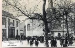
22 septembre Les Gageries de la Saint- Michel au Vasais