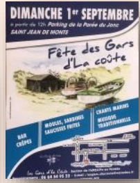
Fête des Gars d'La côte le 1er septembre