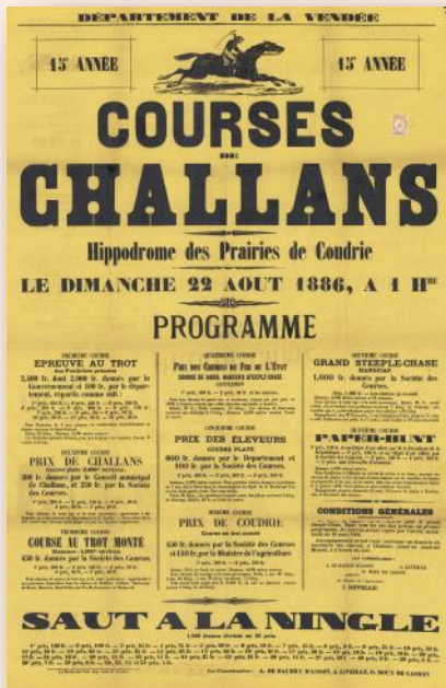
Programme des courses de Challans, du 22 août 1886. Coll. Association Société d'histoire et d'études du Pays challandais.