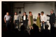
Des maux de guerre... Des mots d'Amour.