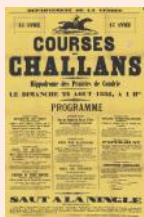
Projet d'inclusion du saut à la ningle au Patri-moine culturel immaté-riel français